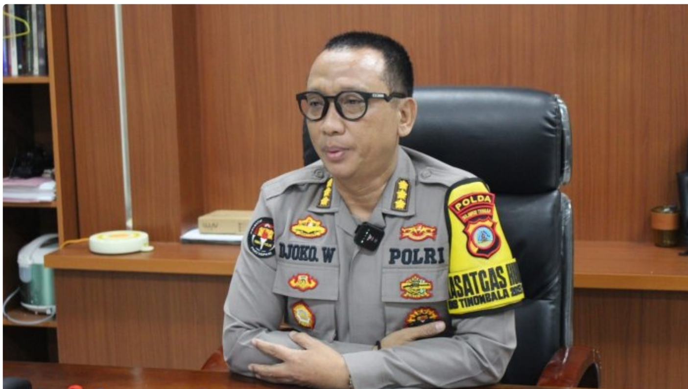
Kabidhumas Polda Sulteng Kombes Pol. Djoko Wienartono

PALU, Sulawesi Tengah- Kepolisian Negara Republik Indonesia (Polri) dalam tahun anggaran (T.A) 2024 kembali membuka pendaftaran penerimaan calon Taruna Taruni Akademi Kepolisian (Akp) untuk putra-putri terbaik lulusan SMA/MA/Sederajat.