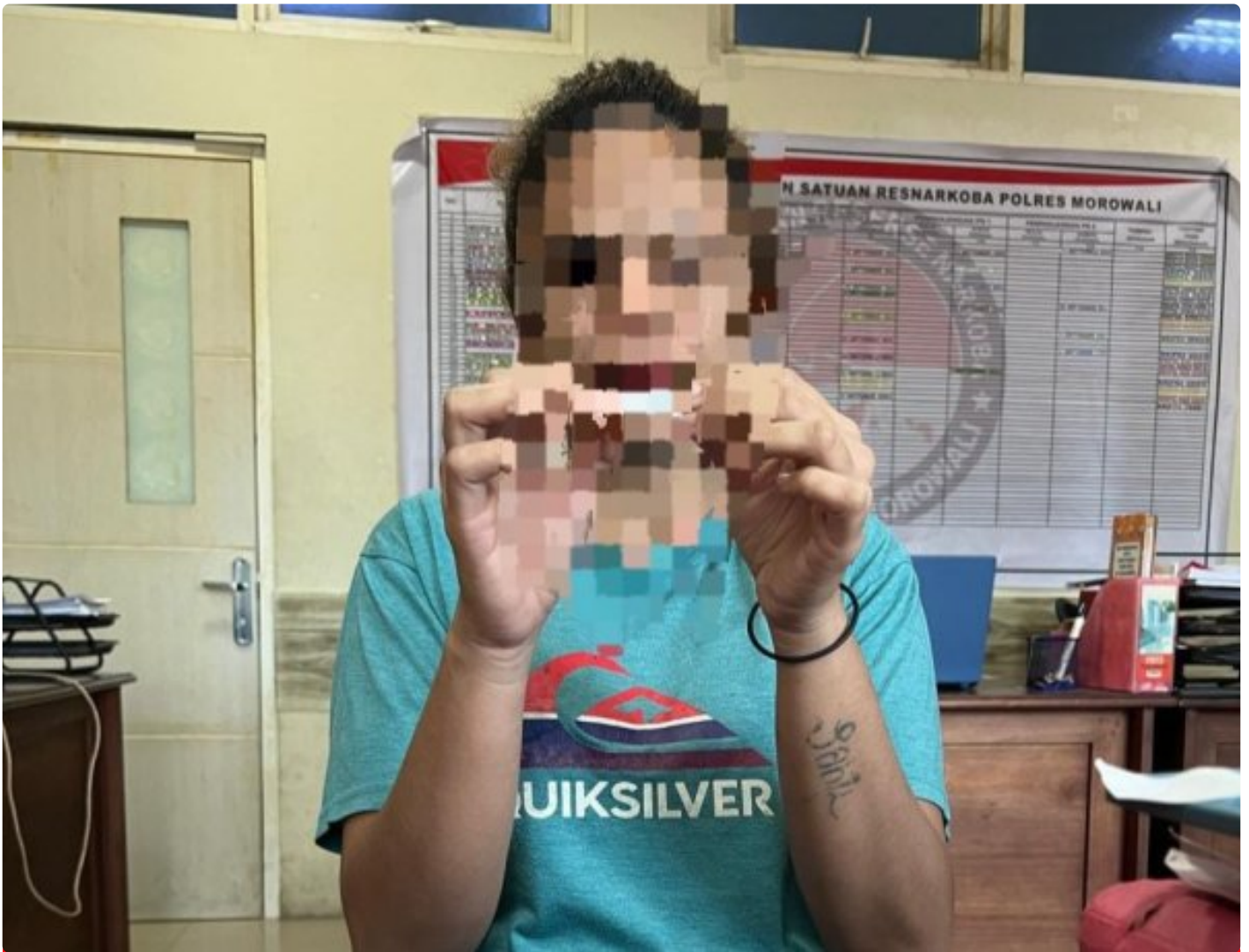
Pelaku Narkotika Seorang Perempuan di tangkap di bahodopi