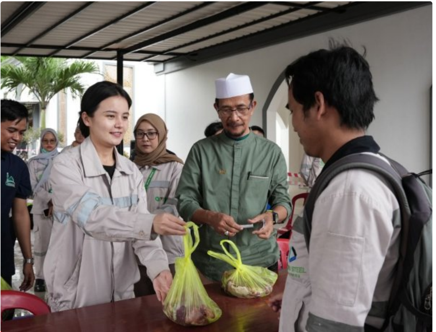
Karyawan non muslim di PT IMIP panitia kurban